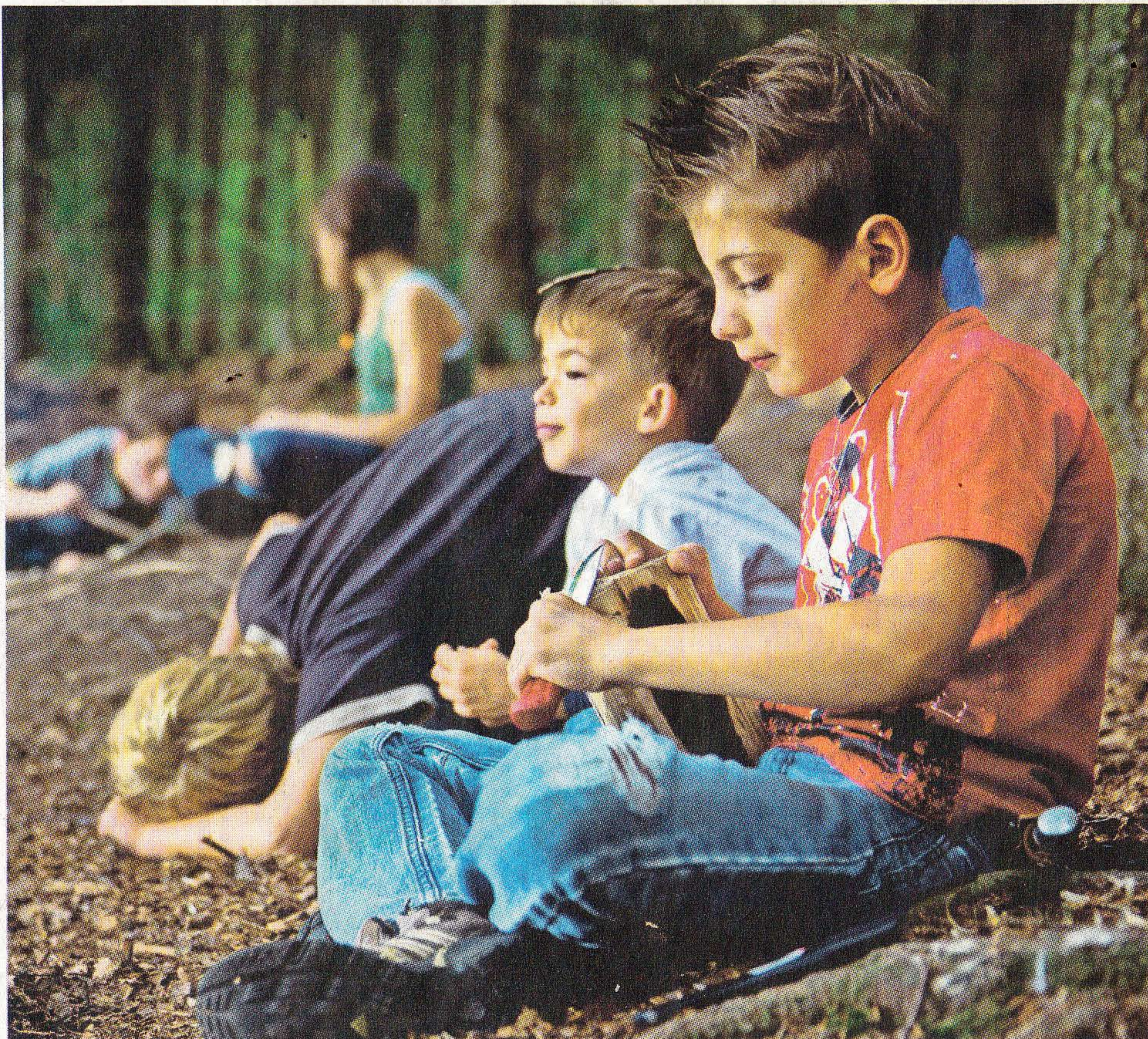
Im Wildniscamp dürfen die Kinder auch mit Schnitzmessern arbeiten.

An diesem Vormittag ist in der einen Ecke ein Versteck unter dem großen bunten Schwungtuch entstanden, in einer anderen Ecke sind dicke Matten auf Kästen gestapelt und bilden eine gemütliche Höhle. „Diese Plätze nutzen die Kinder oft, um sich auszuruhen“, erzählt Jaskulla, die im Haus der Kinderarbeit den Kinderbereich leitet. Wer eine Auszeit braucht, kann bei der Stadtranderholung auch eines der